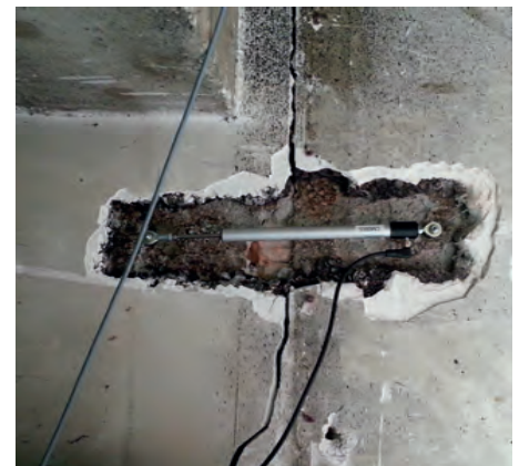
Crackmeter / Extensometer

Eine kostengünstige Alternative sind einfache 1-Frequenz-GNSS-Sensoren. Sehr kurze Messintervalle und spezielle Algorithmen bei der Datenauswertung liefern hochpräzise Verschiebungsmessungen. Die Stromversorgung kann an entlegenen Stellen bei Bedarf über Stromaggregate und Solarpanele dauerhaft sichergestellt werden.