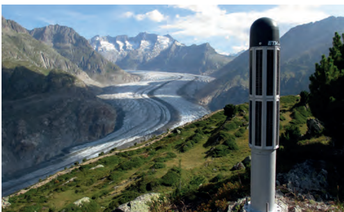
Komplettsystem inkl. Solarpanelen und Datenübertragung

Eine kostengünstige Alternative sind einfache 1-Frequenz-GNSS-Sensoren. Sehr kurze Messintervalle und spezielle Algorithmen bei der Datenauswertung liefern hochpräzise Verschiebungsmessungen. Die Stromversorgung kann an entlegenen Stellen bei Bedarf über Stromaggregate und Solarpanele dauerhaft sichergestellt werden.