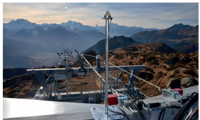
GNSS-Lowcost-Antenne am Beispiel einer Seilbahnstütze